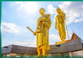
หลวงพ่อคูณ วัดบ้านไร่