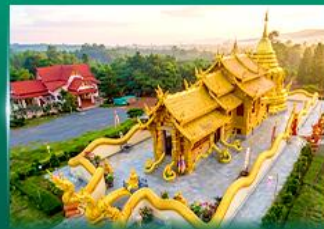
วัดเทพนิมิตประดิษฐ์