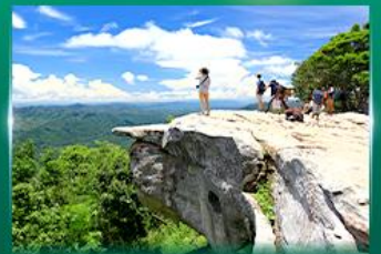
จุดชมวิวดาสุตาแผ่นดิน