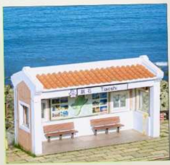
Tiaoshi Bus Station