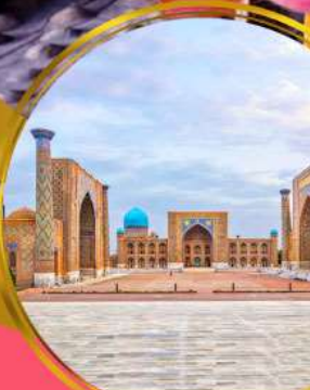
จัตุรัสเรอิสถาน