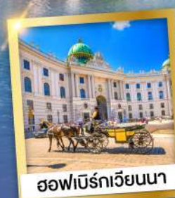
ฮอฟเบิร์กเวียนนา