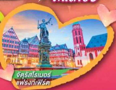
จัตุรัสโรเมอร์ แฟรงก์เฟิร์ต