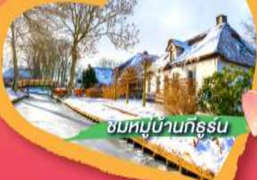
ชมหมู่บ้านกรูริน