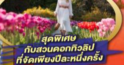
สุดพิเศษ กับสวนดอกทิวลิป ที่จัดเพียงปีละหนึ่งครั้ง