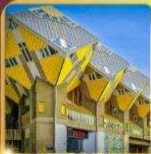
บ้านลูกเต่า โค้ทคูบัส

“ล่องเรือหลังคากระจก” ชมกรุงอัมสเตอร์ดัม