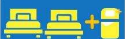
เตียง 3 ท่าน ที่นอนเสริม TRIPLE