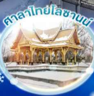
ศาลาไทยโหลซานบี