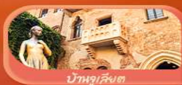
บ้านจูเลียต