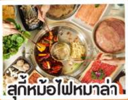
สุกัหม้อไฟหม่าล่า