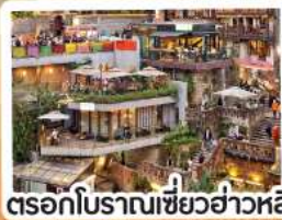
ตอรอกโบราณเซียวฮ่าวหลี่