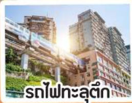
รถไฟฟ้ากะลุดติก