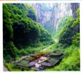
หลุมฟ้าสะพานสวรรค์