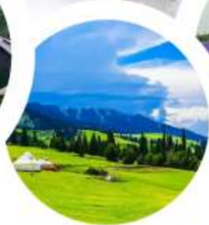
ทุ่งหญ้านาราตี