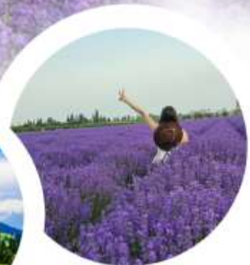
ทุ่งดอกลาเวนเดอร์