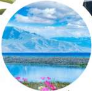
ทะเลสาบไซลีมี