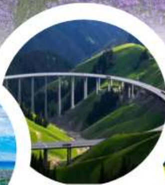
สะพานกว้อจื่อโกว