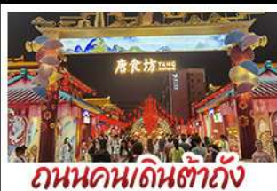
ถนนคนเดินต้าถิง