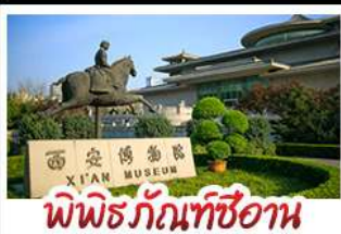
พิพิธภัณฑ์ซีอาน