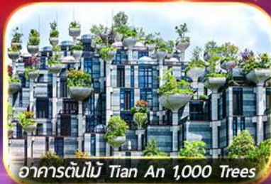
อาคารต้นไม้ Tian An 1,000 Trees