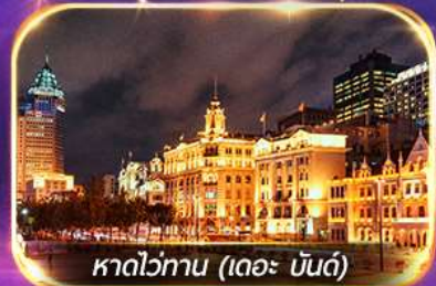
หาดว่ทาน (เดอะ บันด์)

เที่ยวดิสนีย์แลนด์เต็มวัน (รวมรถรับ-ส่ง)