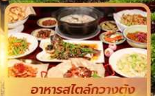
อาหารสไตล์กวางตุ้ง