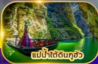
แม่น้ำใต้ดินกุ๋อ