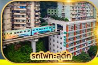
รถไฟฟ้าสุดค