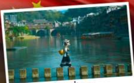
หมู่บ้านเฟิ่งทง

สุดคุ้ม!! พัก 5 ดาว ทุกคืน มนตร์เสน่ห์เมืองเก่า ริมสาងน้ำแจ่มใสแสน