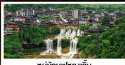
หมู่บ้านฟุทงเจิน