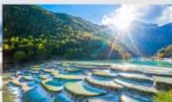
ทะเลสาบไป๋สุ่ยเหอ

*ทางบริษัทฯ ขอสงวนสิทธิ์ในการปรับเปลี่ยนโปรแกรมทัวร์ตามความเหมาะสมขึ้นอยู่กับสถานการณ์ปัจจุบัน โดยคำนึงถึงผลประโยชน์ของลูกค้าเป็นสำคัญ