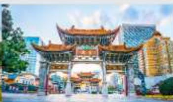
ประตูน้ำก่องไถ่หยก