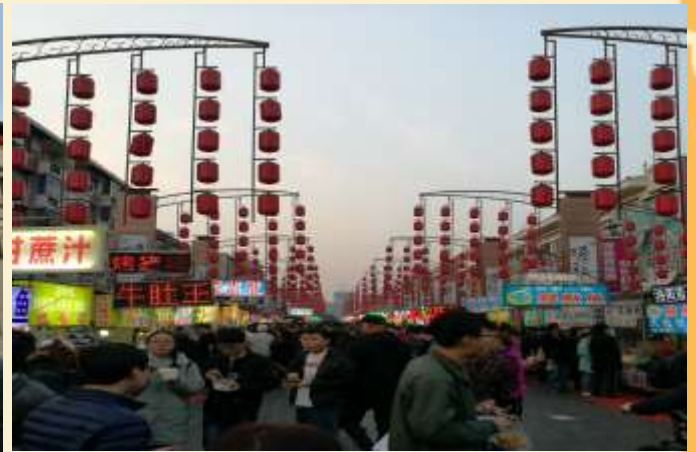
ค่ำ 📍 บริการอาหารค่ำ ณ ภัตตาคาร ที่พัก REZEN HOTEL ระดับ 4 ดาว หรือเทียบเท่า