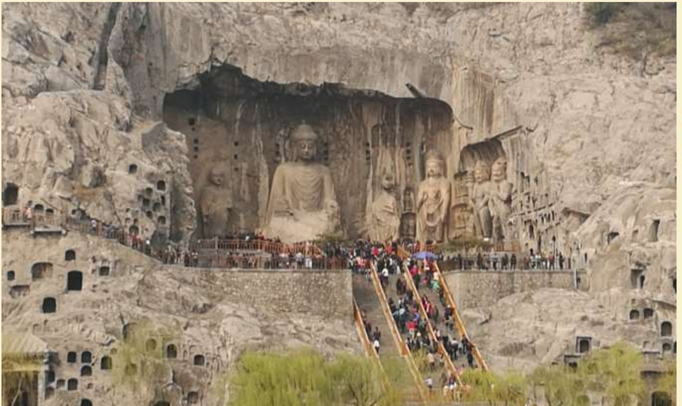
มีพระประธานสูง 17 เมตรสลักอยู่กลางถ้ำรายล้อมด้วยพระโพธิสัตว์และทวยเทพ

บาล รวมถึงการเขียนภาพจิตรกรรมลงบนผนังถ้ำ .....ปัจจุบันยูเนสโกประกาศให้หลงเหมินเป็นมรดกโลกทางวัฒนธรรมในปี ค.ศ. 2000 นำท่านชมถ้ำเฟิ่งเซียนชื่อ ซึ่งเป็นจุดไฮไลต์ ภายในถ้ำ