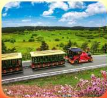
"อุทยานเขานางฟ้า"

บินตรงลงชิง • อุ้หลง หลุมฟ้าสะพานสวรรค์ • ระเบิดยงแกว • อุทยานเขานางฟ้า หงหยาดัง • นังรถไฟทะลุติ๊ก • ล่องเรือชมฉางชิ่งยามค่ำคืน • ศาลาประชาคม (ด้านนอก) มรดกโลกผาหินแกะสลักต้าจู้ • เมืองโบราณสี่ปาที้ • วัดหลิวฮั่น • ตึกตะเกียบ