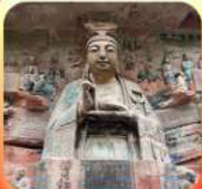
"ผาหินแกะสลักต้าจู้"