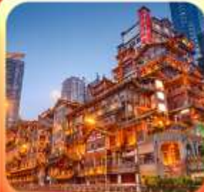
"ล่องเรือชมวิวหงหยาดัง"