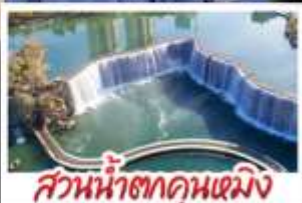
สวนน้ำตกคุณมิ่ง