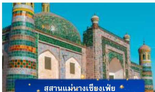
สุสานแม่นางเซียงเฟย

ที่พัก FENGWUQI HOTEL เทียบเท่าหรือระดับ 3 ดาวท้องถิ่น