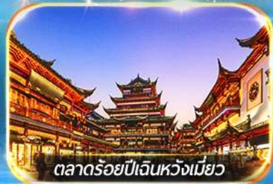
ตลาดร้อยปีเงินหวงเมี่ยว

ถ่ายรูปชมสวนนอร์มัลด์ , เข็กอินหาดไว่กาน, วัดพระหยกขาว อิสระช้อปปิ้งถนนนานกิง POPMART FLAGSHIP STORE