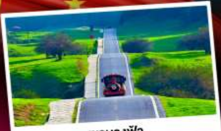
เขานางฟ้า