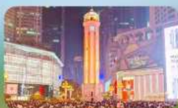
ถนนคนเดินเจียฟางเป่ย์