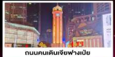
ถนนคนเดินเจียงฟางเป่ย์