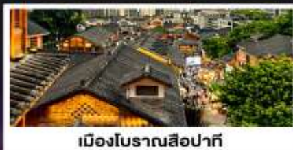
เมืองโบราณสือปาตี