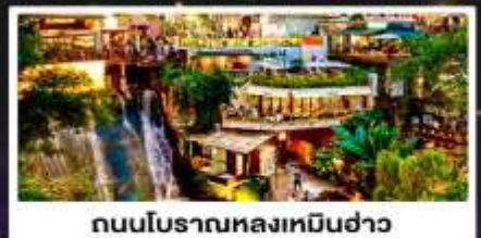
ถนนโบราณหลงเหมินฮ่าว