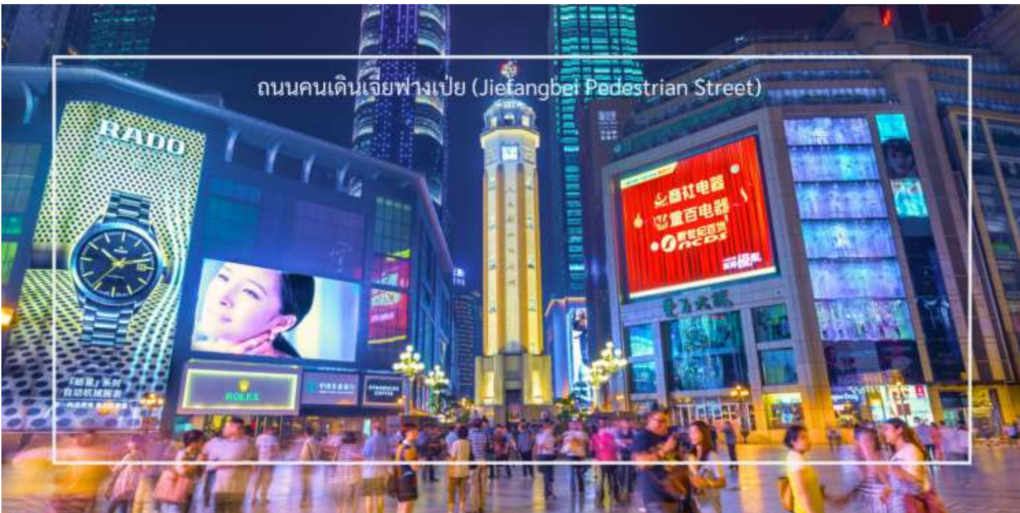
ถนนคนเดินเจี๋ยฟางเป่ย์ (Jiefangbei Pedestrian Street)

เครื่องประดับ และของที่ระลึก ท่านสามารถ แวะช้อปปิ้งร้านดัง “POPMART” ร้านดังจากจีน ที่รวมฟิกเกอร์ดีไซน์เก๋และตุ๊กตาน่ารักหลากหลายซีรีส์ยอดนิยม เช่น Molly, Dimoo, Labubu และอีกมากมาย ที่สายสะสมของเล่นไม่ควรพลาด เย็น อีศระอาหารเย็นให้ท่านรับประทานอาหารตามอัธยาศัย