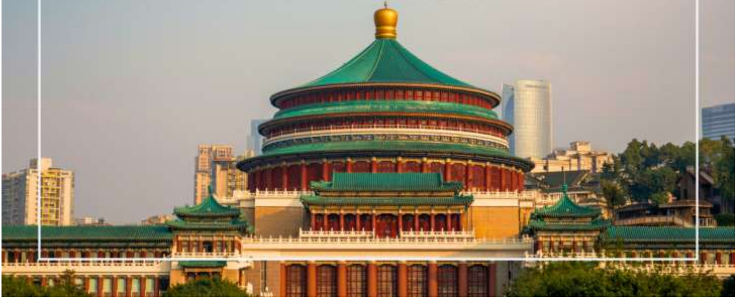
มหาศาลาประชาชนแห่งเมืองฉงชิ่ง (Chongqing People's Grand Hall)

เที่ยง บริการอาหารเที่ยง ณ ภัตตาคาร (มื้อที่ 7) เมนูพิเศษ : สุกี้หม่าล่า