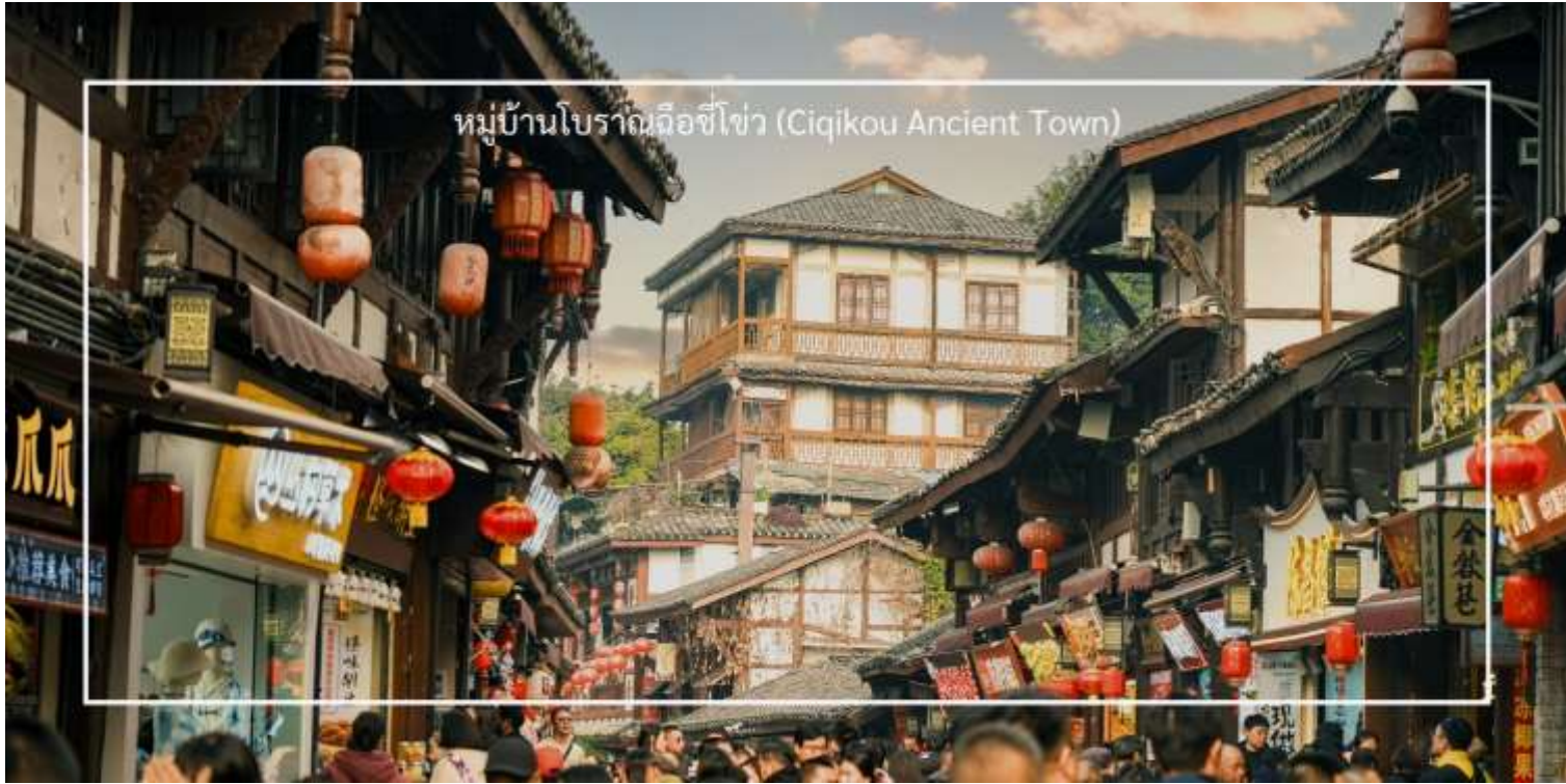
หมู่บ้านโบราณฉีโข่ว (Ciqikou Ancient Town)

จากนั้นเดินทางไปยัง ตลาดหงหยาดัง (Hongyadong) หรือที่เรียกว่า "Hongya Cave" เป็นสถานที่ท่องเที่ยวที่มีชื่อเสียงในเมืองฉงชิ่ง โดยตั้งอยู่ริมแม่น้ำแยงซี มีบรรยากาศที่เต็มไปด้วยวัฒนธรรมและประวัติศาสตร์ ตลาดหงหยาดังเป็นพื้นที่ที่มีอาคารแบบดั้งเดิมที่สร้างขึ้นในสไตล์สถาปัตยกรรมแบบชิโน-ทิเบต โดยมีร้านค้า ร้านอาหาร และบาร์จำนวนมาก ที่นี้คุณสามารถลิ้มลองอาหารท้องถิ่นที่อร่อย เช่น ฮอทพอตฉงชิ่ง (Chongqing Hot Pot) และขนมพื้นเมืองอื่นๆ นอกจากนี้ ตลาดหงหยาดังยังมีวิวทิวทัศน์ที่สวยงาม โดยเฉพาะในช่วงเย็นเมื่อไฟประดับส่องสว่าง ที่ทำให้บรรยากาศมีความโรแมนติกและน่าตื่นตาตื่นใจ คุณสามารถเดินเล่นตามทางเดินที่มีการจัดแสดงงานศิลปะและสินค้าท้องถิ่น