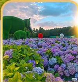
ดอกไม้ตามฤดูกาล