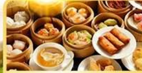
อาหารกวางตุ้ง