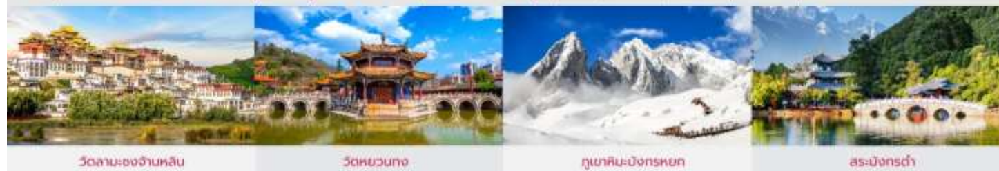
วัดลามะของจันหลิน