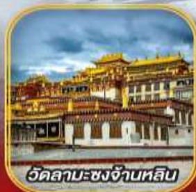
วัดลามะ-ชงจ้านหลิน

เมนูพิเศษ! สุกี่ปลาหมอน อาหารกวางตุ้ง, หมมจีนข้ามสะพานสโตร์ชูนาน