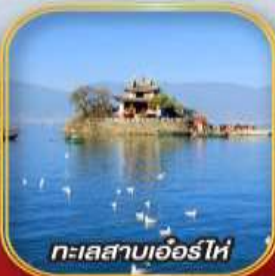
ทะเลสาบเอ๋อร์ไห่