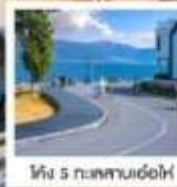
ทะเลสาบเอ๋อไห่