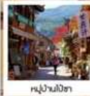
หุบผาน้ำร้อน