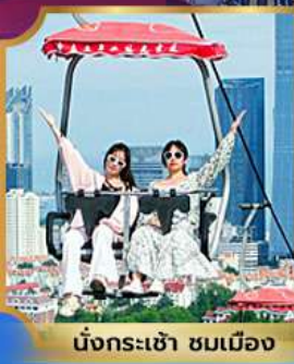
นั่งกระเช้า ชมเมือง