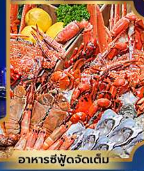
อาหารซีฟู้ดจัดเต็ม

บุฟเฟ่ต์เบียร์ไม่อื่น + ซีฟู้ด + ปิ้งย่างเกาหลี