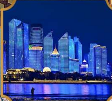
หาดโซเบอร์ฟังก์