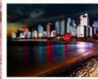
หาดโซเบอร์ NO.3