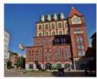
โรงงานเบียร์ชิงเต่า