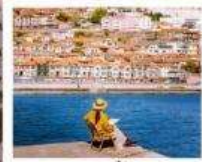
หาดซาจื่อฮั่ว