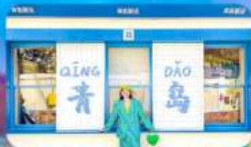
ถนนหลงเจียง