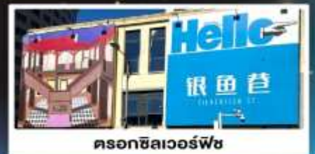
ดรอกซิลเวอร์ฟิช