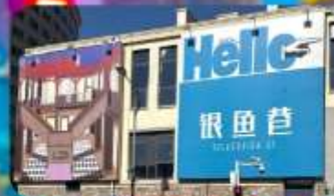
ตรอกซิลเวอร์ฟิช