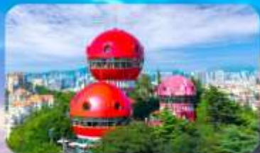
จุดชมวิว SIGNAL HILL