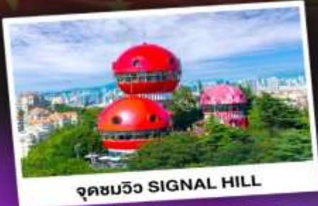
จุดชมวิว SIGNAL HILL