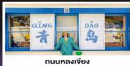
ถนนหลงเจียง