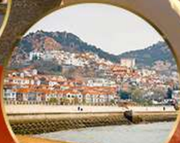
ซาจื่อไห่