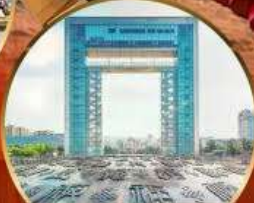
ประตูแห่งความสุข