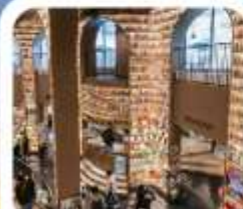
"ห้องสมุดจงซูเก๋"