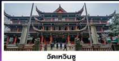
วัดเหวินซู