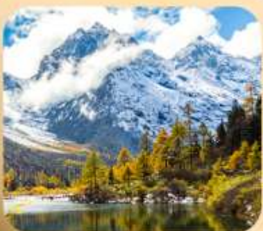
“ปี่ผิงโกว”

ชมธรรมชาติ 2 อุทยานขึ้นชื่อ อุทยานภูเขาสี่ดรุณี + อุทยานปี่ผิงโกว สะพานหนานเฉียว • ถนนคนเดินไก่อู๋หลี่ + ซุนซีลู่ + Pop Mart • ดงเจียวจื่อ