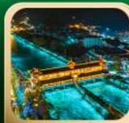
“สะพานหนานเฉียว น้ำตาสีฟ้า”