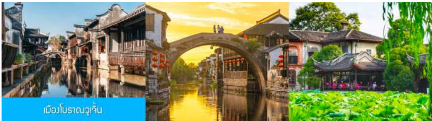
เมืองโบราณวูเจิ้น