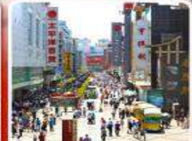
ช้อปปิ้งถนนคนเดินชุนซีลู่