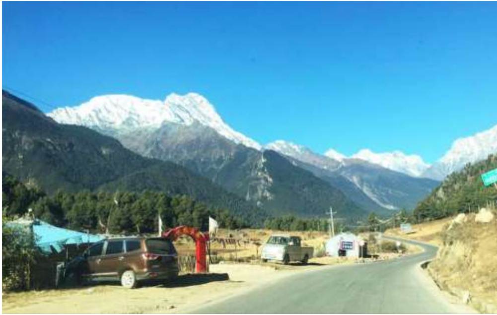
พาท่านเดินทางสู่ด่านพรมแดน จีน-เนปาล ใช้เวลาเดินทาง 1 ชั่วโมงโดยประมาณ