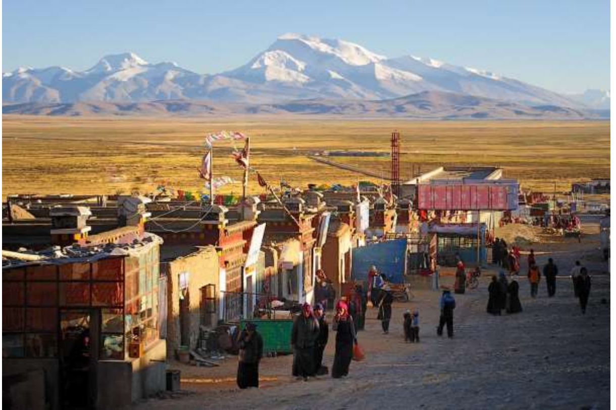
ที่พัก Dharchen Himalaya hotel