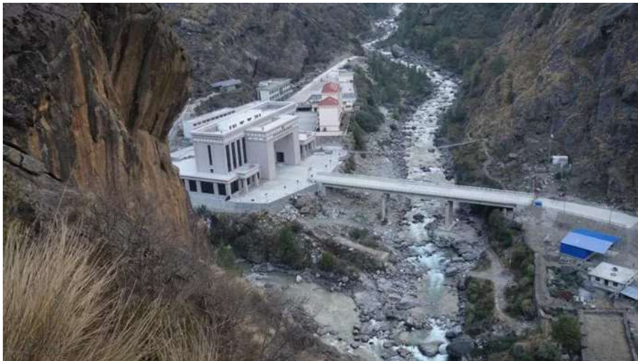
ถึง ด่านพรมแดน พาท่านเดินทางตรวจคนเข้าเมืองโดยการเข้าเนปาลสำหรับคนไทยต้องใช้วีซ่า