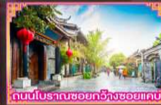
ถนนโบราณซอยกว้างซอยแคบ