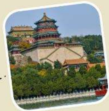
4 พระราชวังฤดูร้อน