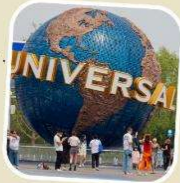
5 UNIVERSAL BEIJING