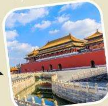
3 พระราชวังต้องห้าม