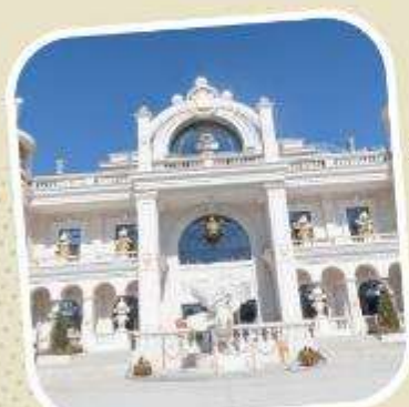
6 POP LAND