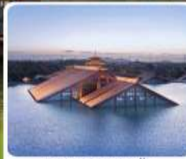
พิพิธภัณฑ์ไดน้ำ กวงฟูหลิน