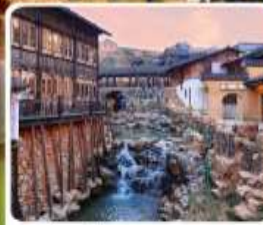
เมืองโบราณเหย้าหู