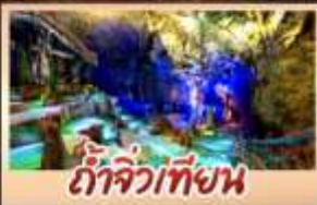
ถ้ำจิ่วเทียน