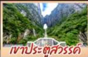
เขาระตุสวรรค์