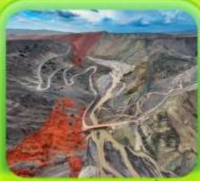
"แกรนด์แคนยอนคู่ชานโจ้ว"

ซินเจียงเหนือ ทะเลสาบโซลิมู่ "น้ำตาหยดสุดท้ายของแอตแลนติก" • กุ้งหนุ่ยอาราตี กุ้งดอกไม้เทียนซาน • ผ่านชมสะพานกั๋วจื่อโกว • ถนนหลิวซิงเจียง • ตลาดต้าปาจา