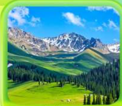
"กุ้งหนุ่ยอาราตี"