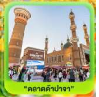
"ตลาดต้าปาจา"

ซินเจียงเหนือ ทะเลสาบโซลิมู่ "น้ำตาหยดสุดท้ายของแอตแลนติก" • กุ้งหนุ่ยอาราตี กุ้งดอกไม้เทียนซาน • ผ่านชมสะพานกั๋วจื่อโกว • ถนนหลิวซิงเจียง • ตลาดต้าปาจา