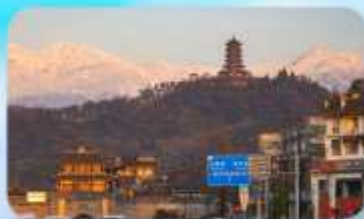
เมืองโบราณกวนเสี้ยน