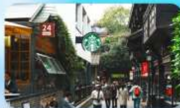
ถนนชอยกวางซวยแคบ