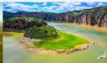
แกรนด์แคนยอนแม่น้ำเหลือง

*ทางบริษัทฯ ขอสงวนสิทธิ์ในการสลับโปรแกรมทัวร์ตามความเหมาะสมขึ้นอยู่กับสถานการณ์ทำงาน โดยคำนึงถึงผลประโยชน์ของลูกค้าเป็นสำคัญ