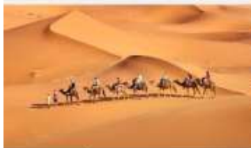
ชี้อูฐชมทะเลทราย