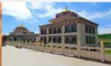
ทำเนียบพระลามะอุหลาน