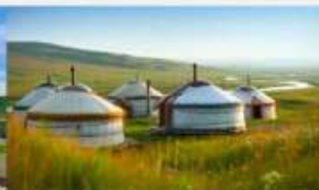
กุ่มหน้าออร์ดอส