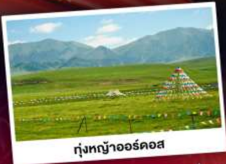
ทุ่งหญ้าออร์ดอส