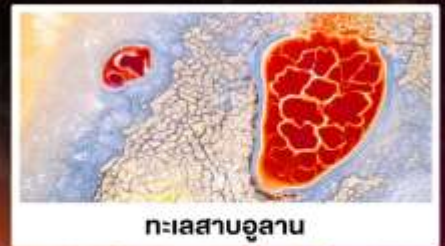
ทะเลสาบอูแลกัน