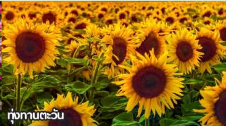
ทุ่งทานตะวัน

จากนั้นนำท่านสู่ ถนนหวังฝูจิ่ง ถนนคนเดินสุดฮิตใจกลางกรุงปักกิ่ง ปัจจุบันถนนนี้เป็นที่นิยมมากในหมู่นักช้อปปิ้งและนักท่องเที่ยวที่ตบเท้าเข้ามาเพื่อเสาะหาของลดราคาและเสื้อผ้าที่มีเอกลักษณ์ไม่ซ้ำใคร ถนนการค้าที่พลุกพล่านแห่งนี้มีมานั่ง บาร์ ร้านอาหาร และคาเฟ่เรียงรายตลอดทางอยู่บนถนนคนเดินสายนี้ ให้ท่านได้ช้อปปิ้งร้าน Pop Mart ที่ใหญ่ที่สุดในปักกิ่งตุ๊กตา box หน้าตาน่ารักที่ดังที่สุดในจีนตอนนี้ ต้องยกให้กับ Pop Mart