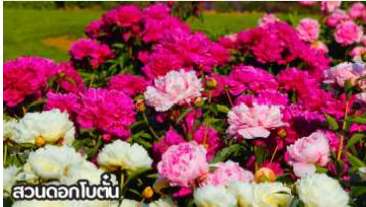
สวนดอกโบตั๋น

เดือนสิงหาคม-ต้นกันยายน ชมทุ่งดอกเบญจมาศหรือดอกไฮเดรนเยีย ดอกเบญจมาศปักกิ่งหมายถึงสายพันธุ์เบญจมาศที่มีต้นกำเนิดหรือนิยมปลูกในกรุงปักกิ่ง ประเทศจีน โดยเฉพาะช่วงฤดูใบไม้ร่วง ที่มีการจัดงานมหกรรมดอกเบญจมาศ แสดงความหลากหลายของสีและรูปร่าง มีสายพันธุ์เช่น "กุสุยจินเสี่ย" ที่ได้รับรางวัลราชาดอกเบญจมาศ และยังมีเบญจมาศปักกิ่งสีขาวที่เป็นสมุนไพรด้วย ที่สำคัญคือเป็นดอกไม้ที่ใช้ในงานเทศกาลและวัฒนธรรม โดยเฉพาะในสวนสาธารณะ เช่น รื่อถาน และอุทยานเป่ย์ไห่ มีหลากหลายสี เช่น ขาว เหลือง ชมพู แดง และม่วง สามารถพบได้ในหลายพื้นที่