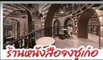
ร้านหนังสือจุกเก๋