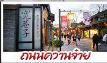
ถนนความจำ